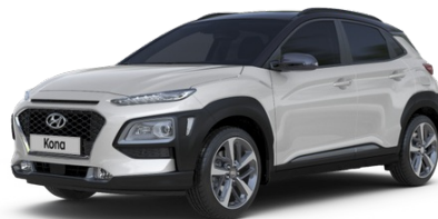
Pilt on illustratiivne