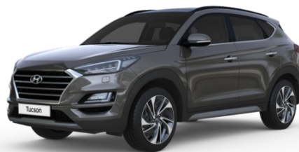
Pilt on illustratiivne